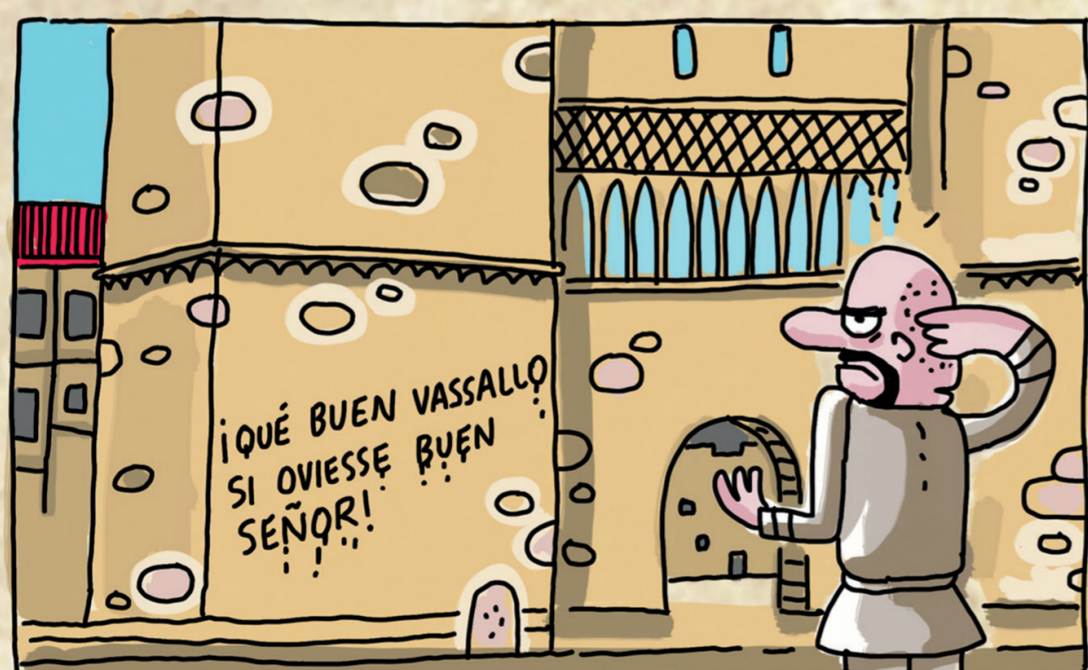
El concejal de Seguridad contempla las pintadas ayer en Valencia.